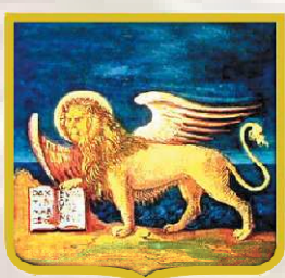
PATROCINIO REGIONE DEL VENETO

Università degli Studi di Padova Dipartimento di Lingue e Letterature Anglo-Germaniche e Slave Dipartimento di Romanistica