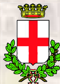
Comune di Padova